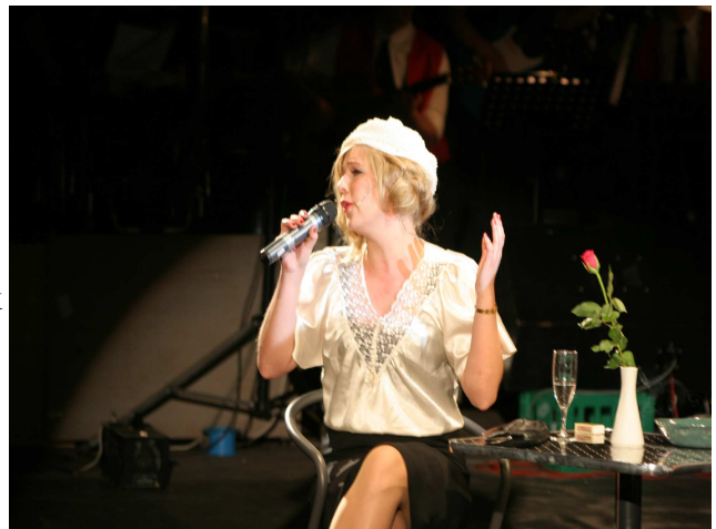
Årets musical var en bragende succes og eleverne fik en stor applaus

En vellykket musical-uge sluttede lørdag den 28. februar, hvor eleverne opførte stykket "Valentin". I den forudgående uge var alle inddelt i grupper, som alle arbejdede sig frem mod forestillingen. Der blev øvet sange, øvet danse, lavet scene og meget andet. Det var en travl og hektisk uge. Tekster fra C.V. Jørgensens album "Sjælland" bandt stykket "Valentin" sammen. Stykket foregik i 1950 og handlede om en filmproducent, som arbejder på filmen "Himlen flyder over". Han bliver udsat for en bagvaskelse fra pressens side og ender med at gå i hundene. Stykket blev en succes på forældre-/vennedagen den 28. februar. Godt 400 var mødt frem for at se stykket. Det var stolte elever, som modtog klapsalver fra forældre og venner. Efter stykket var der en fest, som rundede en hektisk uge af for skolens elever.