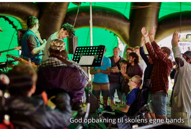
God opbakning til skolens egne bands

Udover koordineringen af de mange aftaler var det vigtigt for skolen, at det var en festival, hvor alle kunne være med.