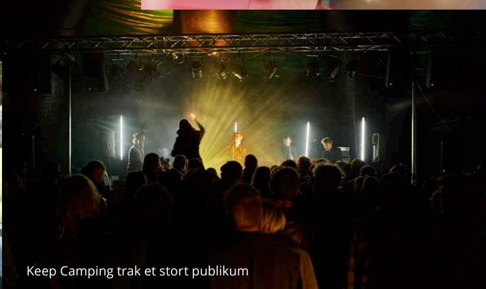
Keep Camping trak et stort publikum