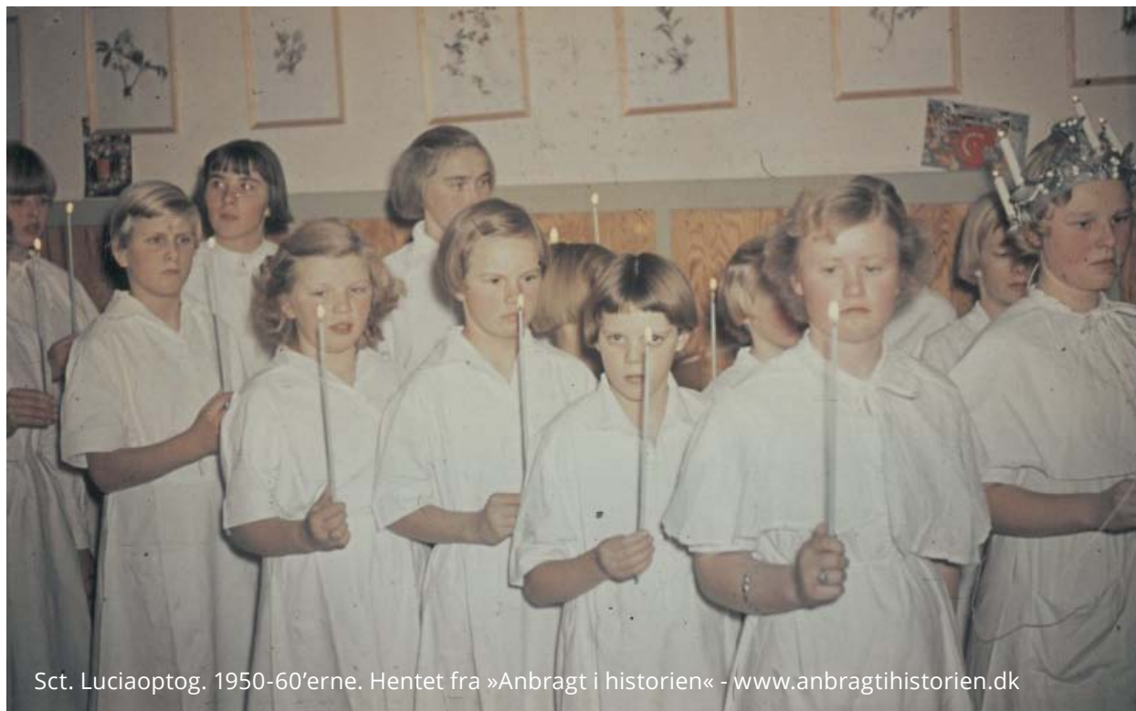
Sct. Luciaoptog. 1950-60'erne.

hæmmedes forplantning. I forbindelse med indførelsen af fosterdiagnostik i Danmark var et af ønskerne at »forhindre fødsel af børn med livsvarigt handicap« og her især børn med Downs syndrom. Teknikkerne hertil har på mange måder vist sig langt mere effektive end fortidens kirurgiske sterilisationer. Siden 2004, hvor nakkefoldsscanninger er blevet indført, er antallet af børn med Down syndrom blevet stærkt reduceret. Hvis udviklingen fortsætter, vil det ifølge beregninger betyde, at Danmark sidste barn med Down syndrom vil blive født i 2030.