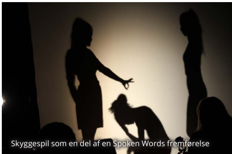
Skyggespil som en del af en Spoken Words fremførelse

På Familie-vennedagen lørdag d. 21. november var der Egmont ON Award Show, hvor de forskellige produktioner blev vist og en jury afgjorde, hvad der var de bedste produktioner.