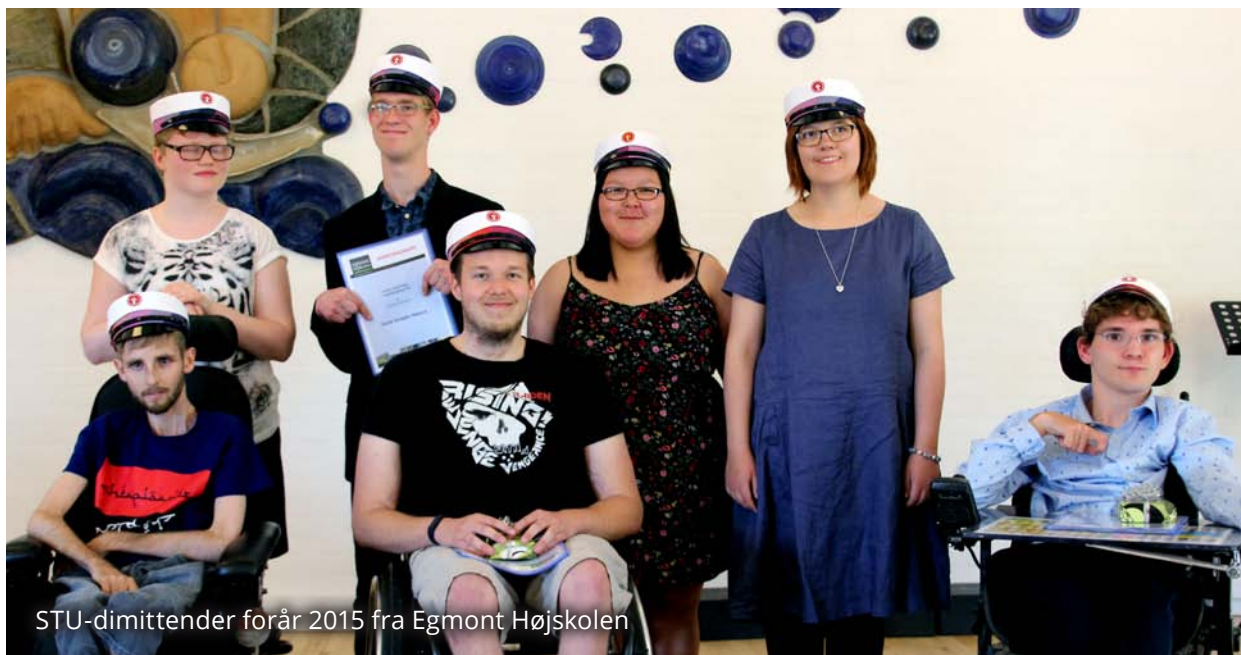
STU-dimittender forår 2015 fra Egmont Højskolen

måske var det bedre, hvis min datter/søn ikke var født/reddet. De er flove og ulykkelige over at kunne tænke sådan.