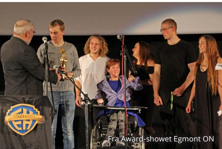
Fra Award-showet Egmont ON

Så var det tid til temauge. Ugens omdrejningspunkt var lyd, billede og tekst. Eleverne var inddelt i fiktive produktionsselskaber. I løbet af ugen blev der arbejdet med forskellige medier, hvor de tre elementer skulle indgå. Grupperne lavede produktioner i kategorier som fx »Rap«, »Stop-motion«, »Dokumentar« og »Livskraft – foto og tekst«.