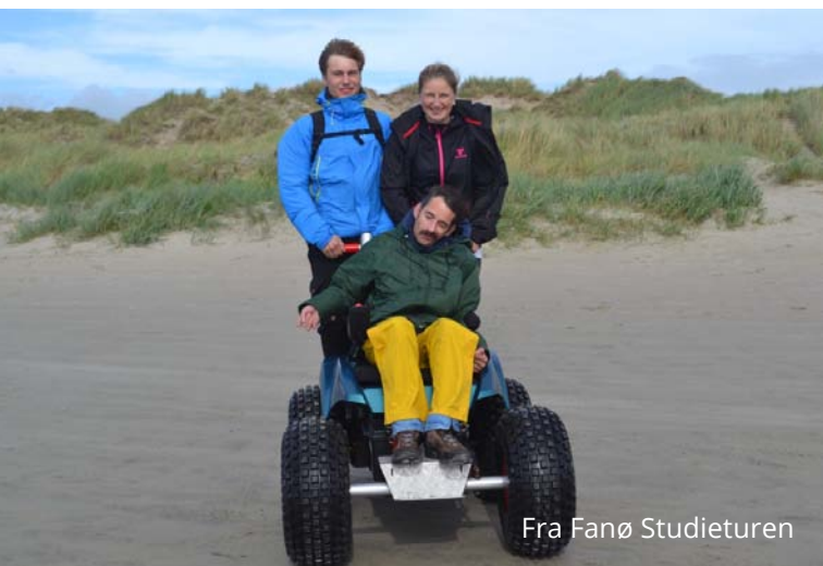
Fra Fanø Studieturen