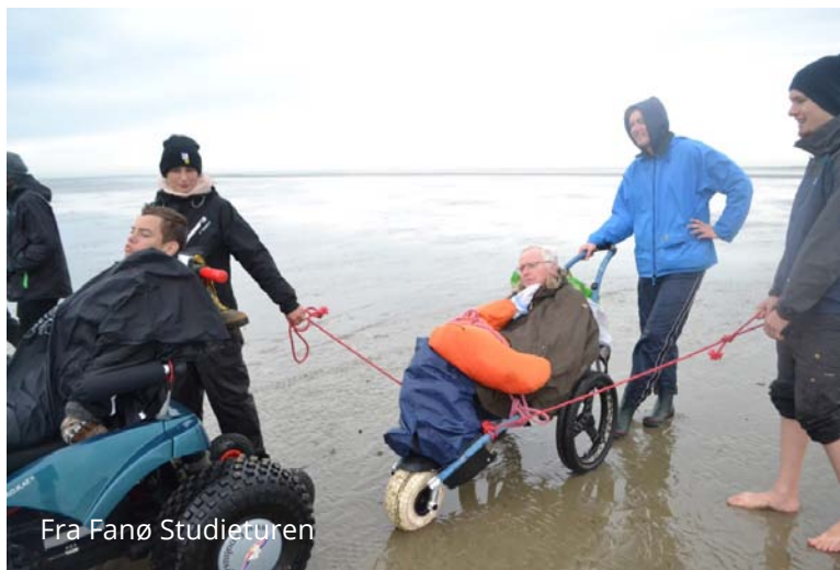
Fra Fanø Studieturen

I løbet af måneden havde vi en del besøg udefra. Der blev holdt seksualvejlederkursus, og foreningen FNUG holdt deres landsmøde i sidste weekend af september.