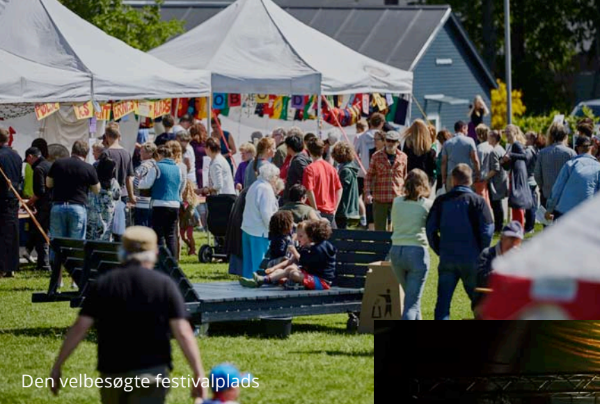
Den velbesøgte festivalplads