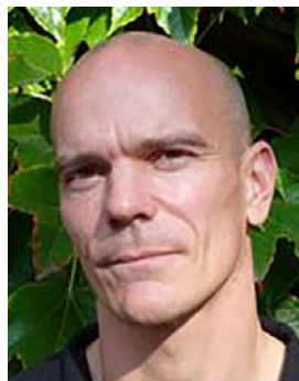
Af Jesper Vaczy Kragh

I 2015 blev 100-året for kvindernes valgret markeret. Historien om grundlovsændringen i 1915 er kendt og mundede ud i en storstilet national fejring under grundlovsweekenden den 5.-7. juni. Hvad der sjældent nævnes i forbindelse med grundlovsændringen er, at mens kvinder og tjenestefolk fik nye demokratiske rettigheder, oplevede andre grupper det modsatte. Danskere på institutioner som åndssvageanstalter, forsorgshjem og psykiatriske hospitaler var i de følgende årtier omfattet af særlove, som fik vidtgående betydning for deres liv. I bogen »På kanten af velfærdsstaten« (2015) er denne oversete del af danmarkshistorien blevet undersøgt, og en række tidligere anbragte og indlagte danskere har