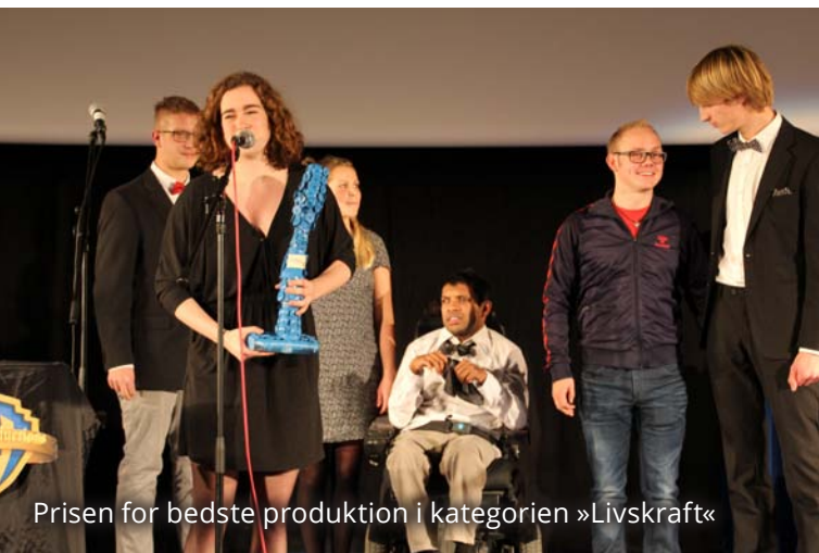
Prisen for bedste produktion i kategorien »Livskraft«

deholdt alt fra vildt sjove til dybt rørende indslag.