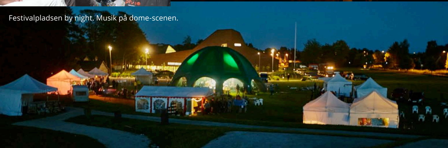
Festivalpladsen by night. Musik på dome-scenen.